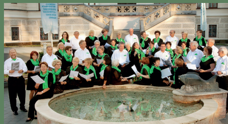
Stadtchor Feldbach, 5. Juli