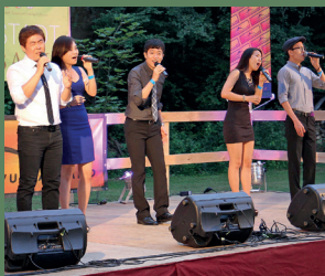
Vokal.Total, 14. Juli