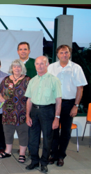
Dichtergilde, 2. Juli