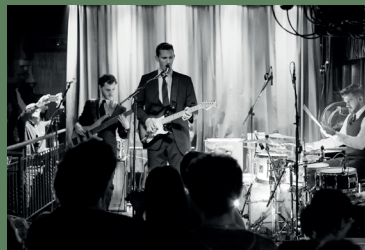
John Mayer Blues Experience, 20. Juli