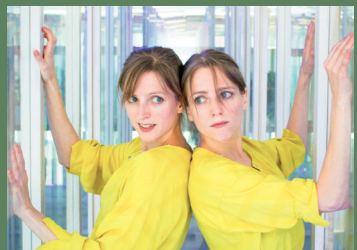
Radeschnig, 19. Aug.