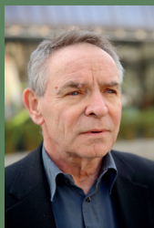
Hengstler, 17. Aug.