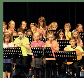
MS der Stadt Feldbach, 30. Juni