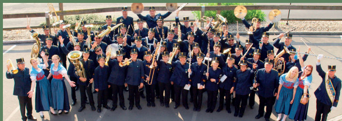
Stadtmusik Feldbach, 8. Juli