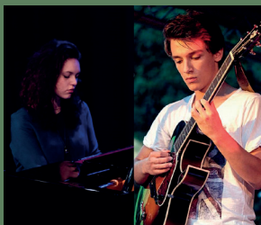
Singer-Songwriter-Abend, 10. Aug.