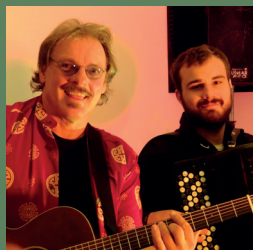
Two on the Rocks, 17. Aug.