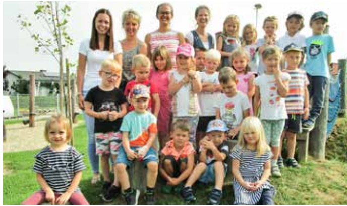
Die Kinder des Kindergarten Leitersdorf freuen sich auf ein erlebnisreiches Kindergartenjahr.

grativer Zusatzbetreuung im Kindergarten. Sie profitieren ebenfalls stark von diesem Thema, weil niemand alleine sein wird.