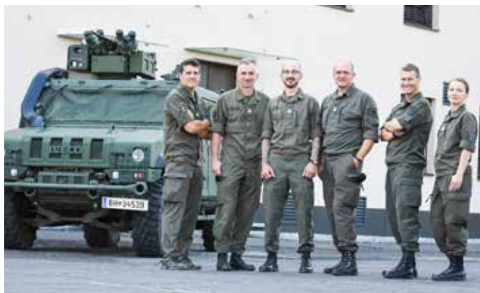
Das Bundesheer bietet nationale und internationale Erfahrungen, gute Verdienstmöglichkeiten und einen sicheren Arbeitsplatz.

Militärpersonen auf Zeit wird nach mindestens drei Jahren eine umfangreiche Berufsförderung oder ein öffentlich-rechtliches Dienstverhältnis mit der Republik angeboten.