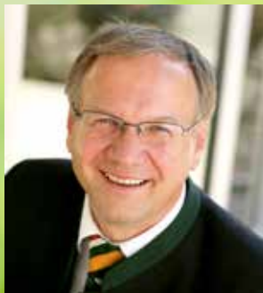
JOSEF OBER Bürgermeister NEUE Stadt Feldbach