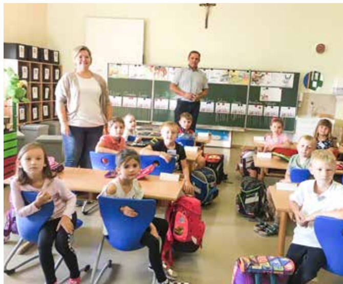
Die Tafelklassler freuen sich auf eine spannende Schulzeit.